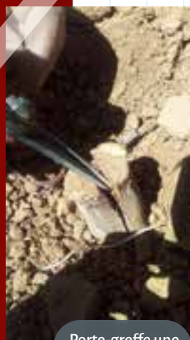
Porte-greffe une fois fendu.

5 Fendre le porte-greffe verticalement à l'aide d'une hachette et d'une massette. La zone fendue est ensuite entourée et serrée avec de la ficelle de chanvre ou de jute (dégradable). Gratter légèrement l'écorce pour bien voir l'orientation et la localisation des vaisseaux.