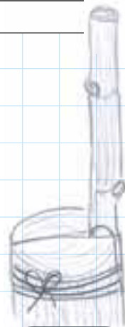
Mise en place du greffon

9 Au fil de la pousse, sélectionner le plus beau rameau et l'attacher. Ébourgeonner le reste. Dans la mesure du possible, conserver le rameau situé dans le flux de sève qui est normalement celui du bas, situé sur l'extérieur. Le greffon est fragile les premières années : attention au travail du sol. On peut sécuriser l'installation en installant un double tuteur, avec un attachage soigné. Le système racinaire de la vigne étant déjà en place, il n'est en général pas nécessaire d'arroser les plants greffés. ●