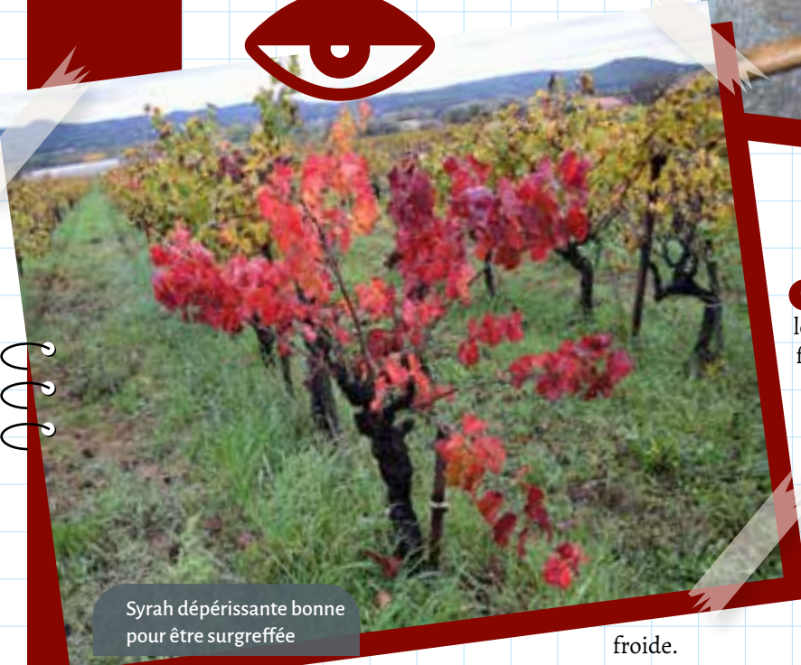
Syrah dépérissante bonne pour être surgreffée