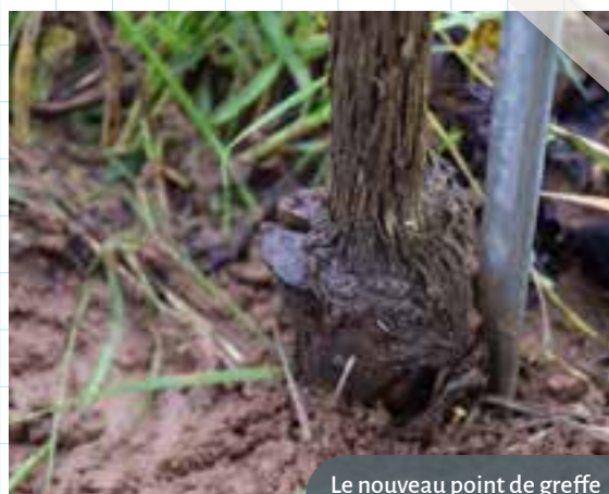
Le nouveau point de greffe après 3-4 ans, productif.