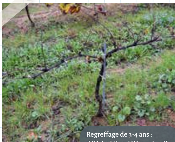
Regreffage de 3-4 ans : déjà établi et déjà productif.