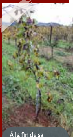
À la fin de sa première saison, la greffe a souvent produit suffisamment de bois pour permettre l'établissement du tronc, parfois d'un bras ou des deux...