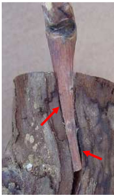
Mauvais contact dû à une fente au niveau d'un noeud