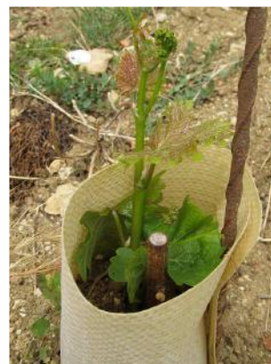
4 à 6 semaines après greffage

De plus, le pied greffé conserve le système racinaire et donc l'âge du cep d'origine. Il y a donc un net gain qualitatif. Enfin, le temps de travail pour greffer est moins important que pour remplacer et le coût des "matières premières" plus faible.