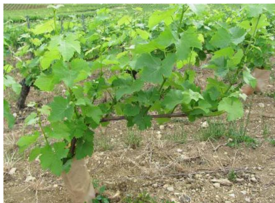
Regreffage d'un an un peu avant fleur

Normalement, le greffon émet des racines la première année. Celles-ci doivent être éliminées à partir du moment où les pousses atteignent 40-50 cm (début juillet) en supprimant la butte de terre. Cette butte ne doit pas être reconstituée, mais il est préférable de replacer le manchon de protection. Si ce travail n'a pas été effectué en juillet, les racines peuvent être supprimées durant l'hiver.