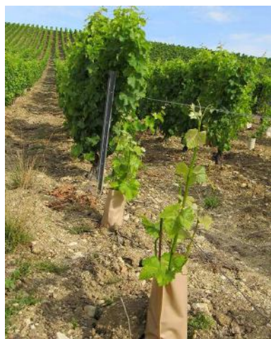
6 à 10 semaines après greffage

En fonction de la rigueur apportée au travail et des conditions météorologiques du printemps, le taux de réussite peut être compris entre 80 et 90%.