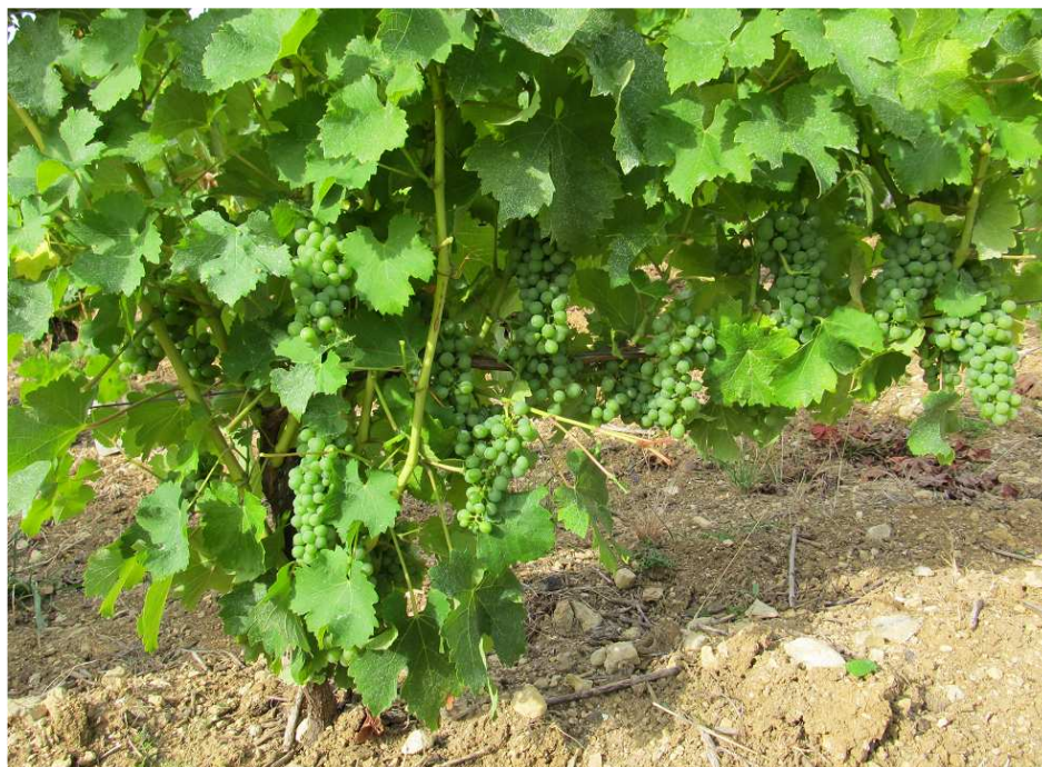
Regreffage de 2 ans à la fermeture de la grappe

Lors de la taille, il est préférable de ne conserver qu'un seul greffon. Si les deux sont conservés, ils risquent de se chasser l'un l'autre lorsqu'ils grossiront. Il faut tailler ce greffon avec 4 à 8 yeux selon sa vigueur. Il ne faut pas hésiter à laisser plus d'yeux que sur un jeune plant car il possède le système racinaire d'un cep adulte.