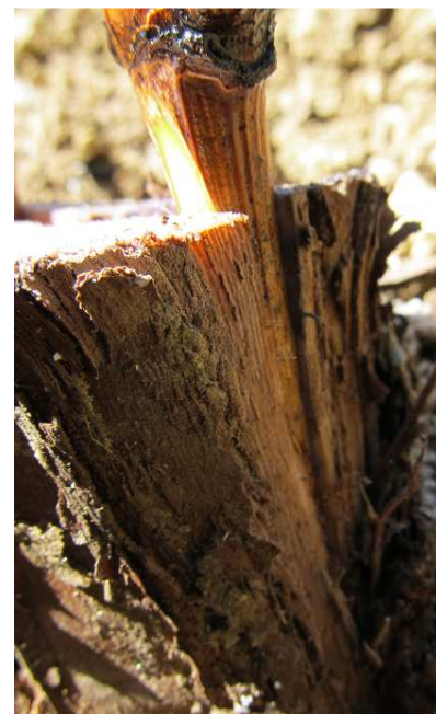
Greffon mal positionné (trop intérieur)