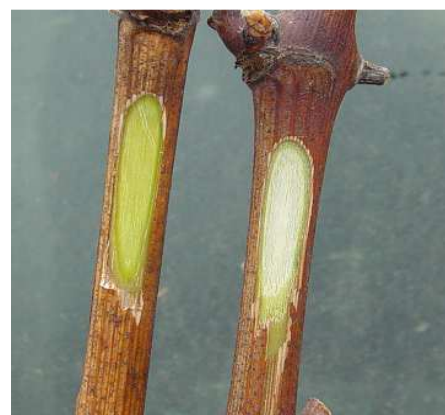
A gauche : bon état de fraîcheur A droite : bois trop sec

Après 24 h les pieds dans l'eau, les bourgeons doivent commencer à gonfler. Ceux qui restent ridés ne doivent pas être employés.