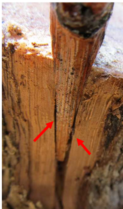
Mauvais contact dû à un mauvais biseau

Si le biseau n'est pas correct ou si le greffon n'est pas positionné correctement, les chances de réussite sont très faibles.